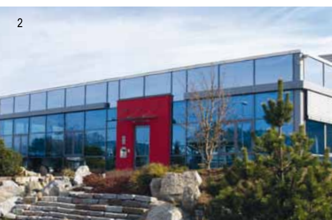
1 Aluminium-Glas-Fassade mit Dachelement Schumacher Packaging GmbH, Sonneberg 2 Aluminium-Glas-Fassade mit vorgehängten Raffstoreanlagen PWG GmbH, Neuhaus-Schierschnitz